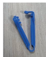
Le système de clamage